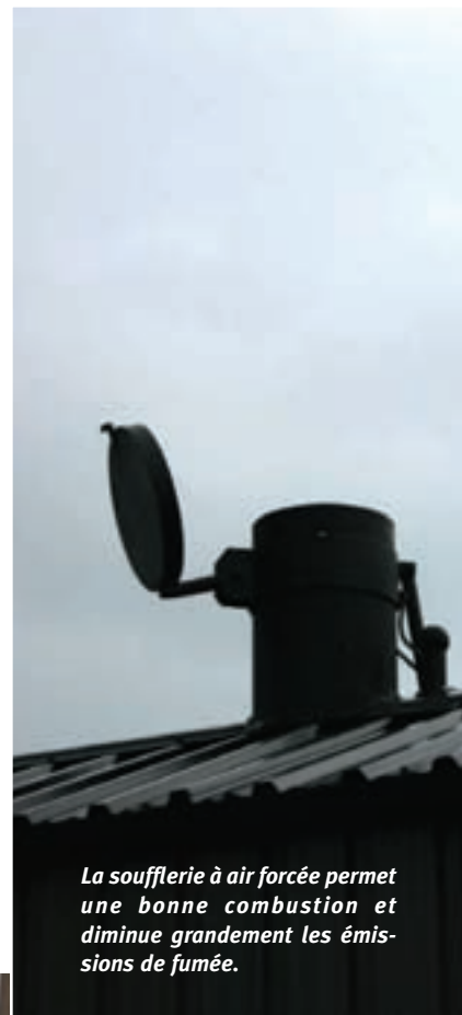
La soufflerie à air forcée permet une bonne combustion et diminue grandement les émissions de fumée.